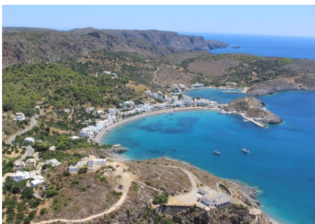
Foto z Kythery. Φωτογραφία από τα Κύθηρα.

Přináší zprávy o svěžím chládku její melodie. Prožité mládí vyvolává bez hořkosti a žalu. Prožité lásky našeptává, dojdou slechu zapomenuté pocity ožívají vprostřed vln sladkého dechu.