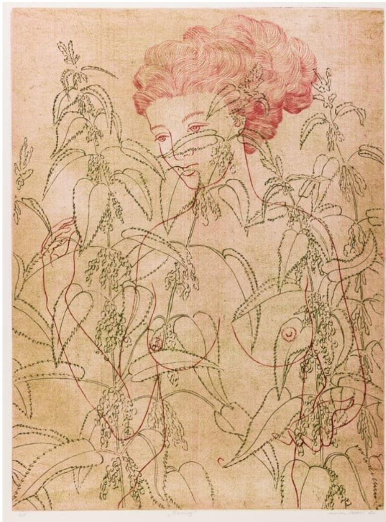
Dušan Černý, Kopřivy, jehlice . 2022. Linoryt. Dušan Černý, Τσουκνίδες . 2022. Λιγγραφία.

předsednictví v EU a koná se pod záštitou Velvyslanectví České republiky v Athénách. Trvání výstavy 09. 11. 2022 – 31. 01. 2023.